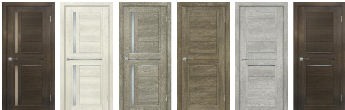
Техно 804 Фреско, Техно 804 Бьянко, Техно 804 Гриджио, Техно 805 Бруно, Техно 805 Чиаро гриджио, Техно 805 Фреско