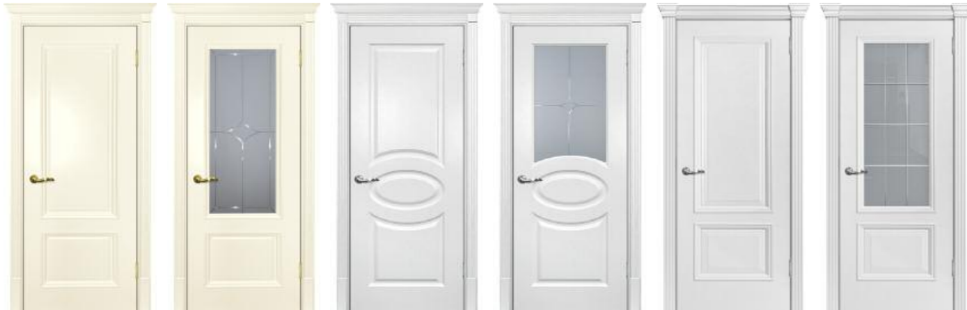
Смальта 07 Слоновая кость, Смальта 12 Молочный, Смальта - шарм 02 Молочный