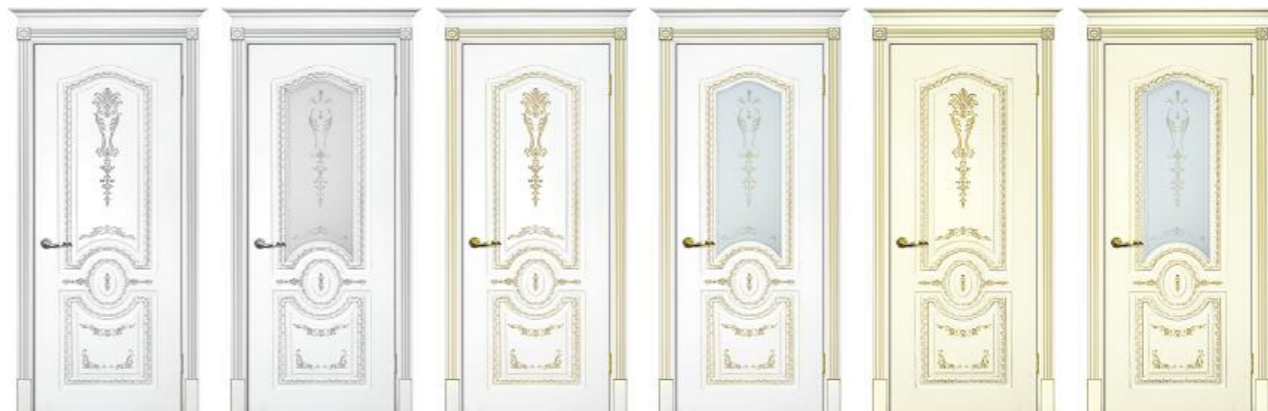
Смальта 11 Белый патина серебро Смальта 11 Белый патина серебро Смальта 11 Белый патина золото Смальта 11 Белый патина золото Смальта 11 Слоновая кость патина золото Смальта 11 Слоновая кость патина золото