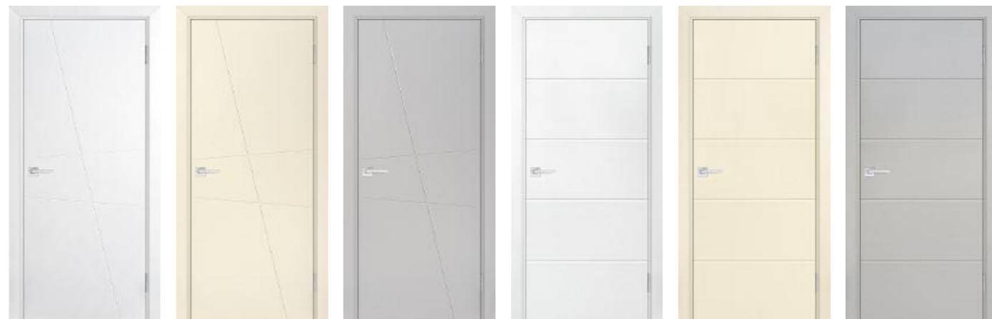
Смальта-лайн 02 Белый Смальта-лайн 02 Айвори Смальта-лайн 02 Агат Смальта-лайн 03 Белый Смальта-лайн 03 Айвори Смальта-лайн 03 Агат