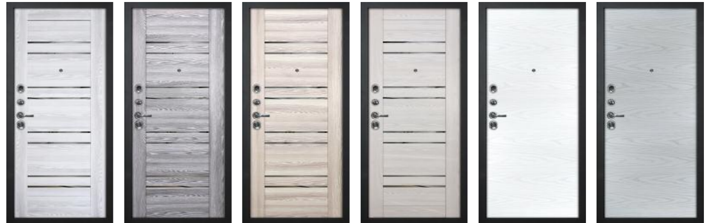
PSK - 1 Ривьера айс PSK-1 Ривьера грей PSK-1 Ривьера крен-экрю PSK-1 Ривьера крем Дуб скай белый Дуб скай серый