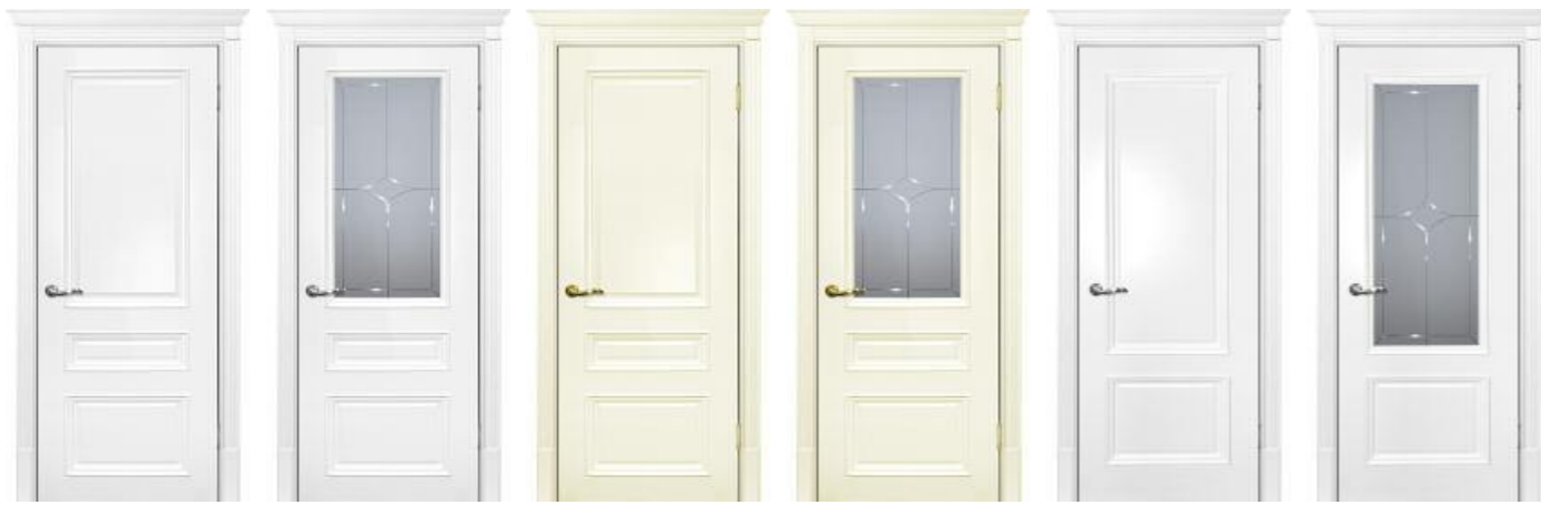
Смальта 06 Белый, Смальта 06 Слоновая кость, Смальта 07 Белый, Смальта 07 Слоновая кость