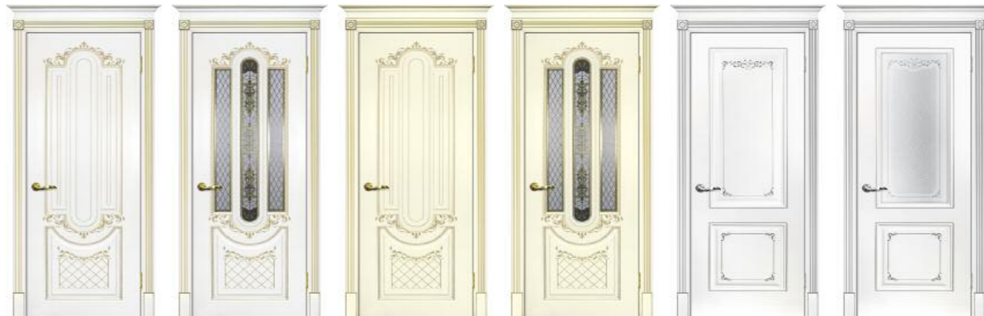
Смальта 13 Белый патина золото Смальта 13 Белый патина золото Смальта 13 Слоновая кость патина золото Смальта 13 Слоновая кость патина золото Смальта 14 Белый патина серебро Смальта 14 Белый патина серебро