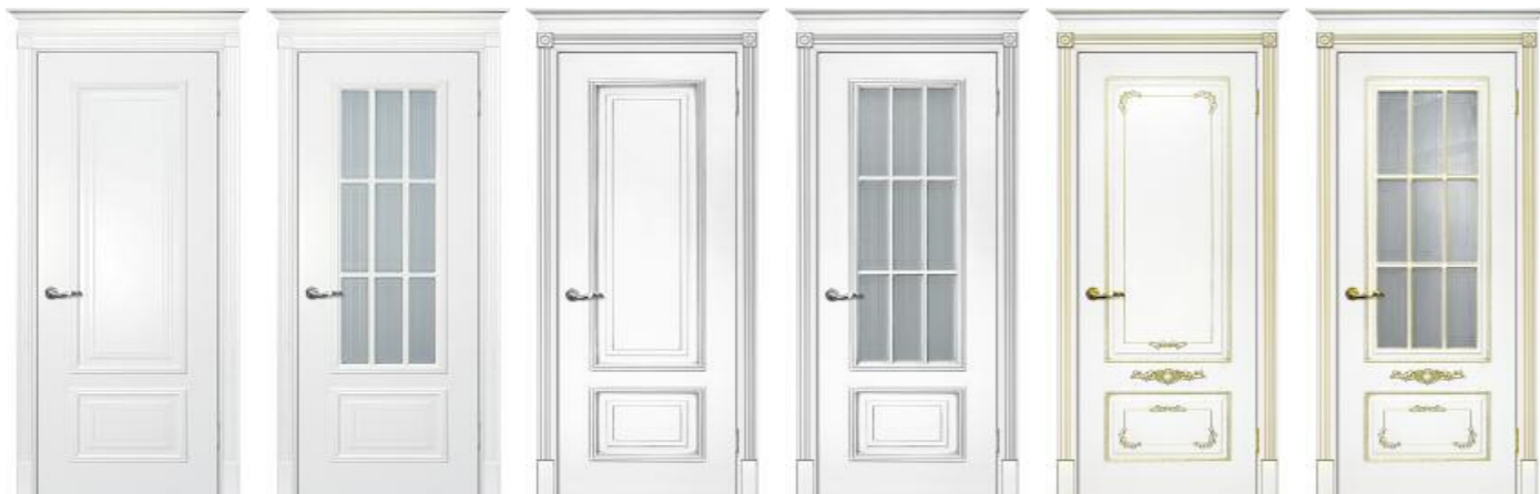
Смальта 08 Белый Смальта 08 Белый Смальта 08 Белый патина серебро Смальта 08 Белый патина серебро Смальта 09 Белый патина золото Смальта 09 Белый патина золото