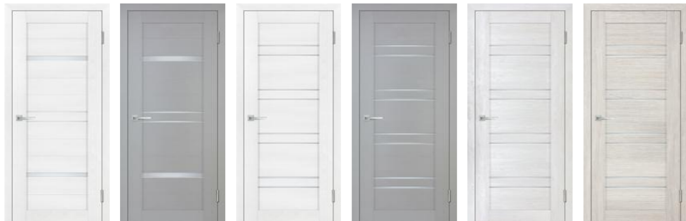
Деко 18 Белый тик Деко 18 Серый тик Деко 19 Белый тик Деко 19 Серый тик Деко 19 Жемчужный Деко 19 Капучино