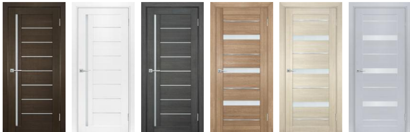
Техно 741 Венге Техно 741 Белоснежный Техно 741 Грей Техно 742 Миндаль Техно 742 Капучино Техно 742 Муссон