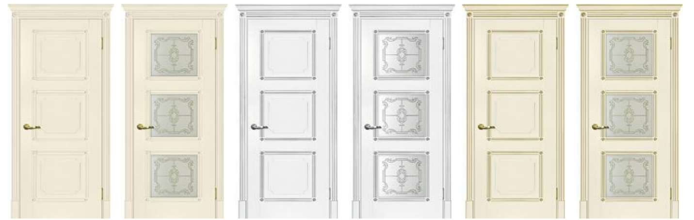
Флоренция 4 Магнолия Флоренция 4 Магнолия Флоренция 4 Белый патина серебро Флоренция 4 Белый патина серебро Флоренция 4 Магнолия патина золото Флоренция 4 Магнолия патина золото