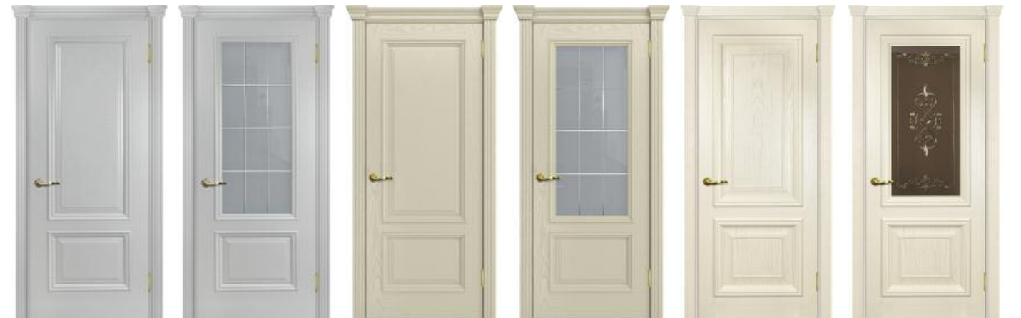
Фрейм 07 Агат, Фрейм 07 Крем, Фрейм 08 Дуб сливочный