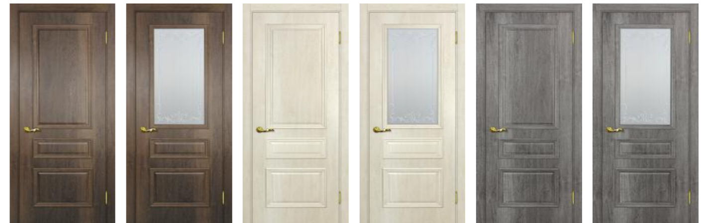
Верона 2 Дуб сан-томе Верона 2 Дуб сан-томе Верона 2 Дуб бриош Верона 2 Дуб бриош Верона 2 Дуб тофино Верона 2 Дуб тофино