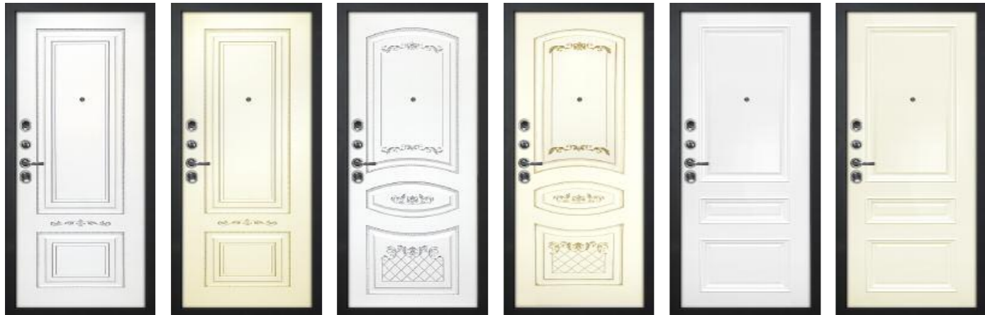
Смальта 04 Белый RAL 9003 патина серебро Смальта 04 Слоновая кость RAL 1013 пат. золото Смальта 05 Белый RAL 9003 патина серебро Смальта 05 Слоновая кость RAL 1013 пат. золото Смальта 06 Белый RAL 9003 Смальта 06 Слоновая кость RAL 1013