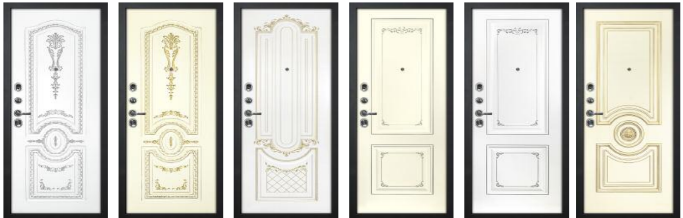
Смальта 11 Белый RAL 9003 патина серебро Смальта 11 Слон. кость RAL 1013 патина золото Смальта 13 Белый RAL 9003 патина золото Смальта 14 Слон. кость RAL 1013 патина шампань Смальта 14 Белый RAL 9003 патина серебро Смальта 18 Слон. кость RAL 1013 патина золото