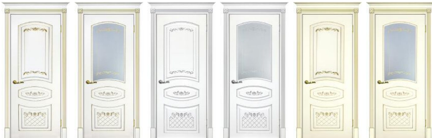
Смальта 05 Белый патина золото Смальта 05 Белый патина золото Смальта 05 Белый патина серебро Смальта 05 Белый патина серебро Смальта 05 Слоновая кость патина золото Смальта 05 Слоновая кость патина золото