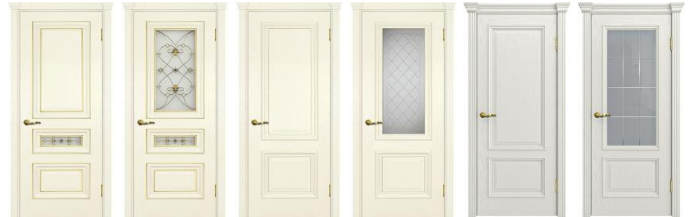
Фрейм 05 Слоновая кость патина золота, Фрейм 06 Слоновая кость, Фрейм 07 Бьянко