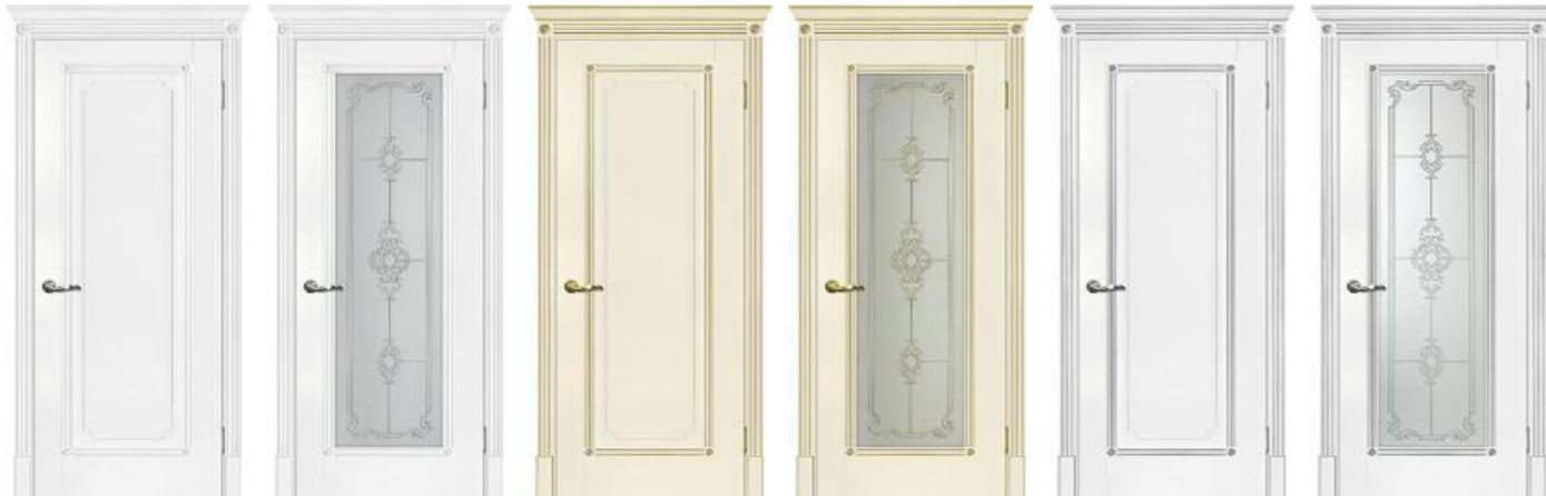
Флоренция 1 Белый Флоренция 1 Белый Флоренция 1 Магнолия патина золото Флоренция 1 Магнолия патина золото Флоренция 1 Белый патина серебро Флоренция 1 Белый патина серебро