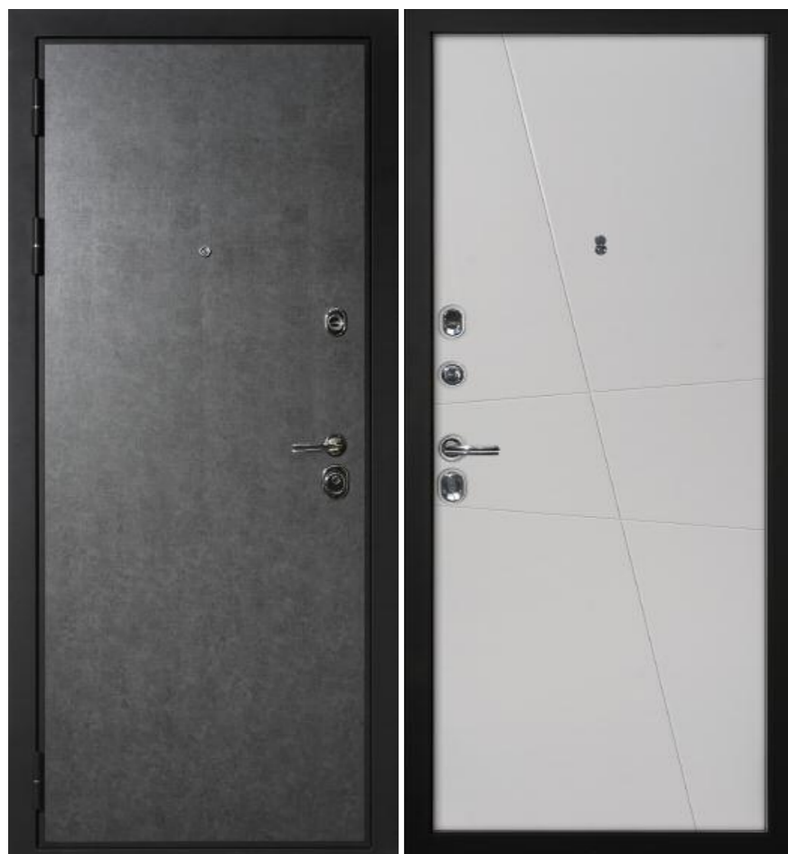
Входная дверь П-2/1 (без внутренней панели)