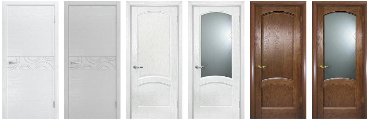
Комбо 02 Ясень белоснежный, Комбо 02 Агат, Вайт 01 Ясень айсберг, Вайт 01 Ясень айсберг, Вайт 01 Дуб, Вайт 01 Дуб