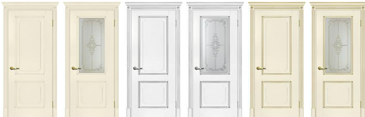
Флоренция 2 Магнолия Флоренция 2 Магнолия Флоренция 2 Белый патина серебро Флоренция 2 Белый патина серебро Флоренция 2 Магнолия патина золото Флоренция 2 Магнолия патина золото