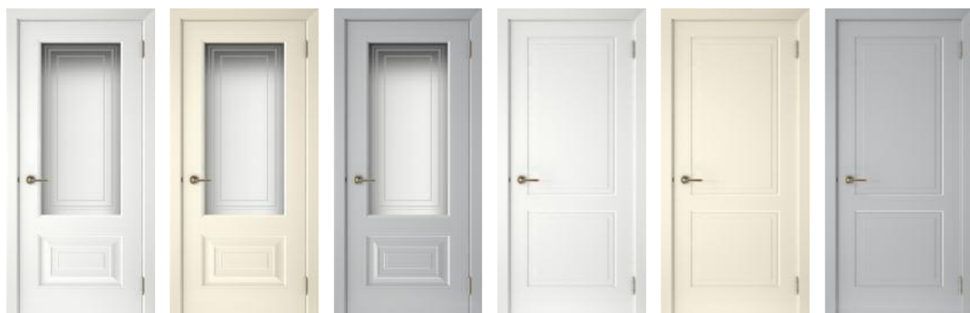
Смальта 46 Белый Смальта 46 Ваниль Смальта 46 Серый Смальта 47 Белый Смальта 47 Ваниль Смальта 47 Серый