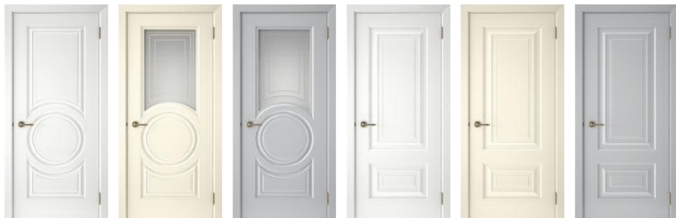
Смальта 45 Белый Смальта 45 Ваниль Смальта 45 Серый Смальта 46 Белый Смальта 46 Ваниль Смальта 46 Серый