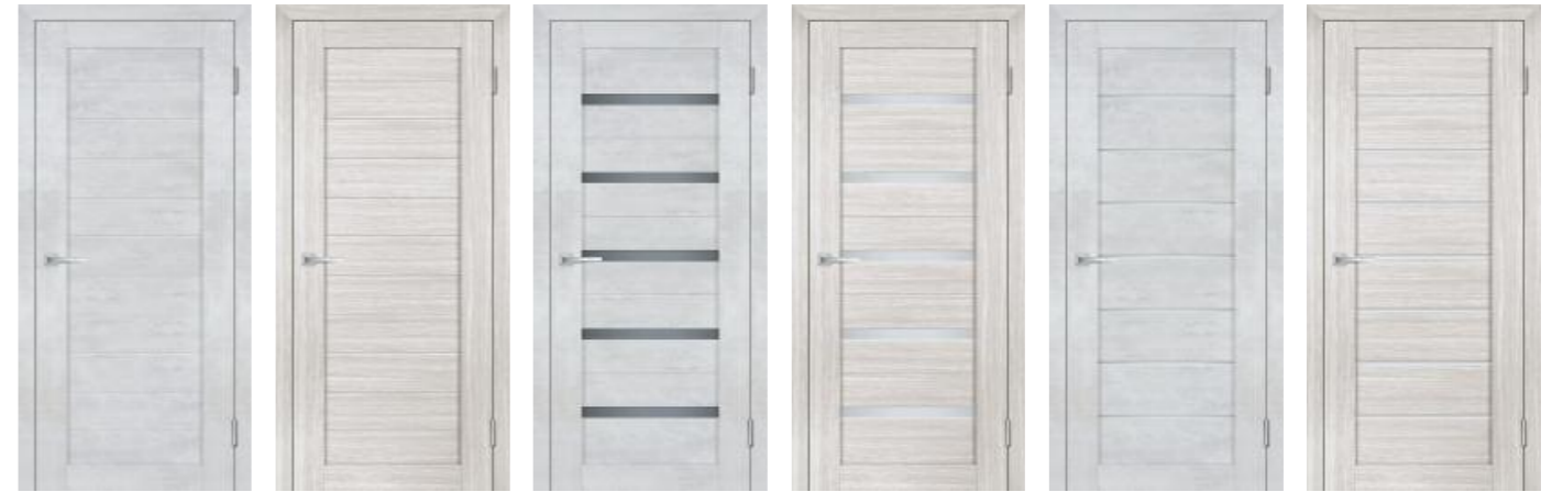
Лайт 06 Бетон снежный Лайт 06 Лиственница белая Лайт 07 Бетон снежный Лайт 07 Лиственница белая Лайт 08 Бетон снежный Лайт 08 Лиственница белая