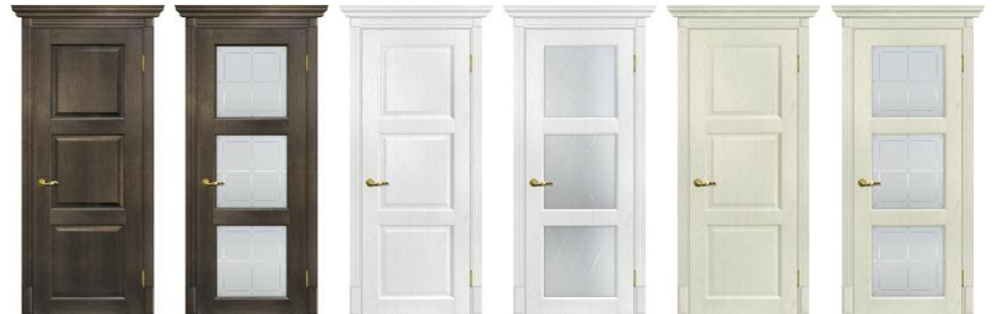
Тоскана 4 Фреско, Тоскана 4 Фреско, Тоскана 4 Пломбир, Тоскана 4 Пломбир, Тоскана 4 Ваниль, Тоскана 4 Ваниль