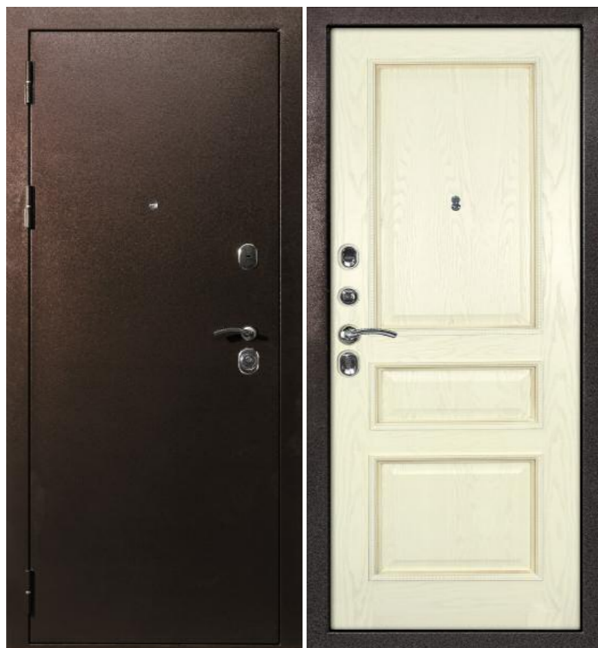
Входная дверь С-3 (без внутренней панели)