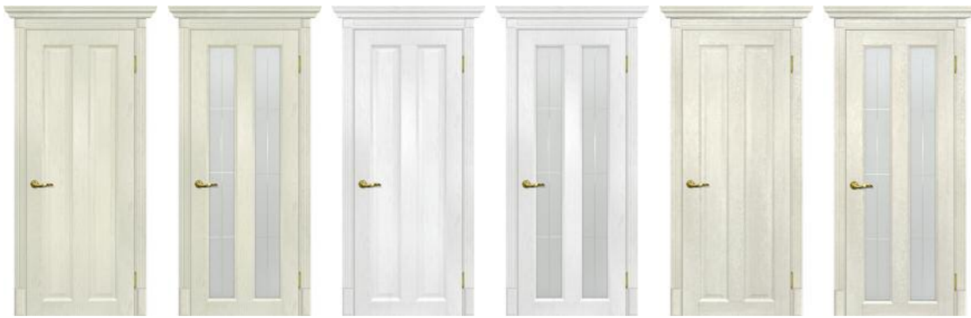
Тоскана 5 Ваниль Тоскана 5 Ваниль Тоскана 5 Пломбир Тоскана 5 Пломбир Тоскана 5 Бьянко Тоскана 5 Бьянко