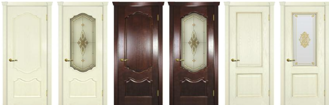
Фрейм 01 Ясень бисквит, Фрейм 01 Красное дерево, Фрейм 02 Ясень бисквит