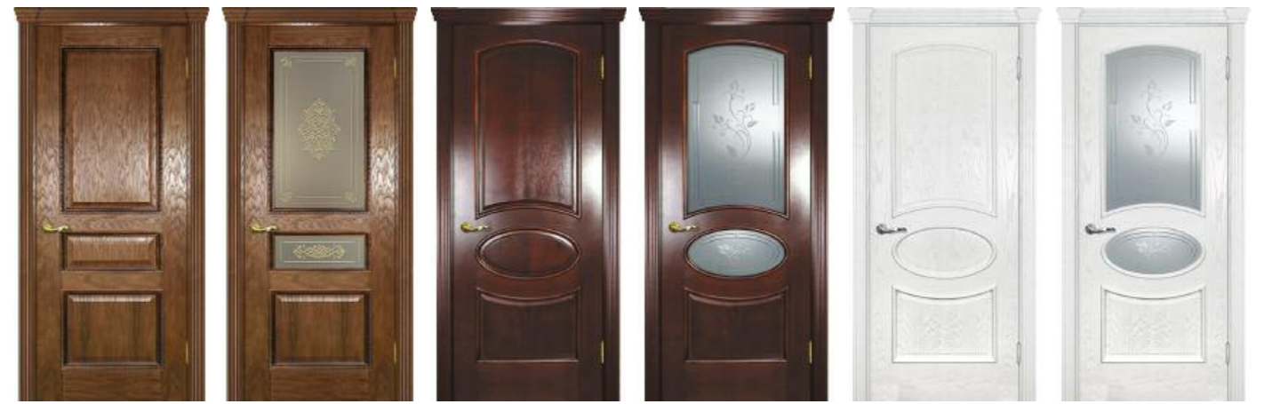
Фрейм 03 Дуб, Фрейм 04 Красное дерево, Фрейм 04 Ясень айсберг