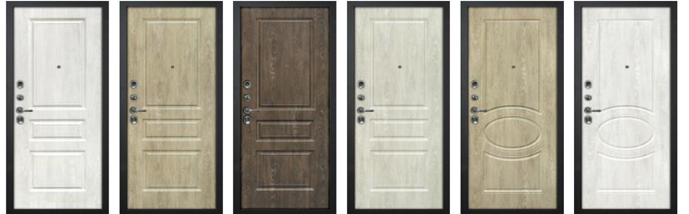
Версаль - 2 Дуб жемчужный Версаль - 2 Дуб песочный Версаль - 2 Дуб корица Версаль - 2 Дуб седой Сиена - 1 Дуб песочный Сиена - 1 Дуб жемчужный