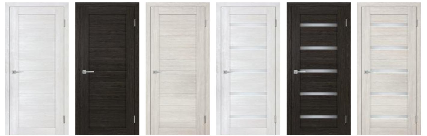
Деко 21 Жемчужный Деко 21 Венге Деко 21 Капучино Деко 22 Жемчужный Деко 22 Венге Деко 22 Капучино