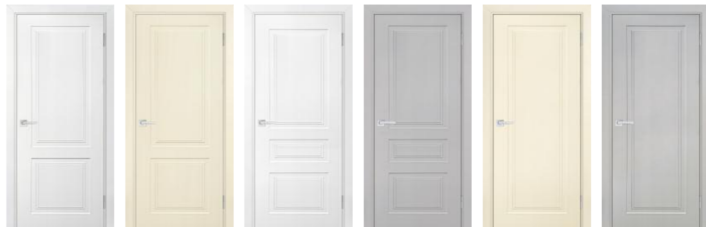
Смальта-лайн 04 Белый Смальта-лайн 04 Айвори Смальта-лайн 05 Белый Смальта-лайн 05 Агат Смальта-лайн 06 Айвори Смальта-лайн 06 Агат