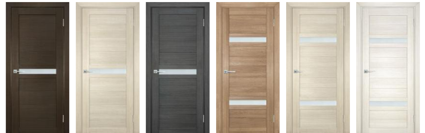
Техно 703 Венге, Техно 703 Капучино, Техно 703 Грей, Техно 705 Миндаль, Техно 705 Капучино, Техно 705 Сандал бежевый