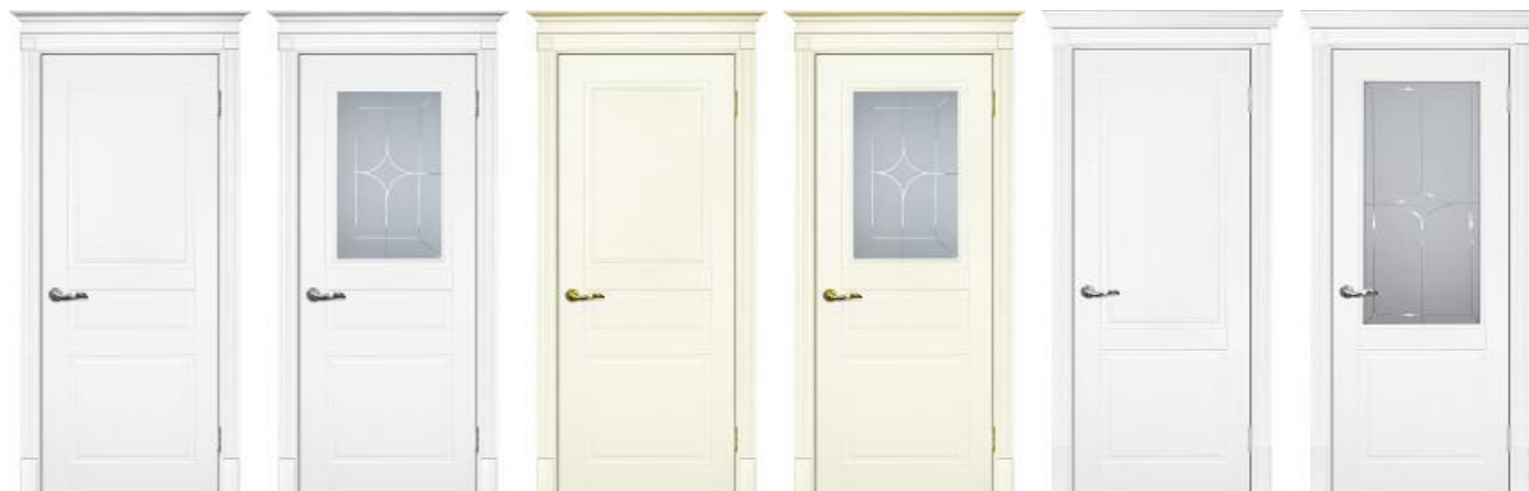
Смальта 01 Белый Смальта 01 Белый Смальта 01 Слоновая кость Смальта 01 Слоновая кость Смальта 15 Белый Смальта 15 Белый