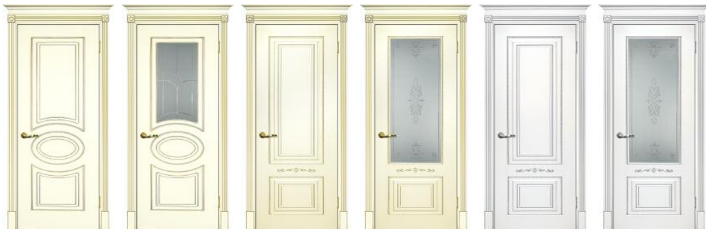
Смальта 03 Слоновая кость патина золото Смальта 03 Слоновая кость патина золото Смальта 04 Слоновая кость патина золото Смальта 04 Слоновая кость патина золото Смальта 04 Белый патина серебро Смальта 04 Белый патина серебро