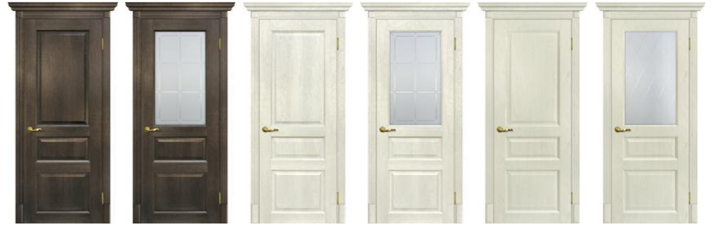
Тоскана 2 Фреско, Тоскана 2 Фреско, Тоскана 2 Бьянко, Тоскана 2 Бьянко, Тоскана 2 Ваниль, Тоскана 2 Ваниль