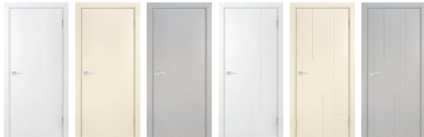
Смальта-лайн 00 Белый Смальта-лайн 00 Айвори Смальта-лайн 00 Агат Смальта-лайн 01 Белый Смальта-лайн 01 Айвори Смальта-лайн 01 Агат