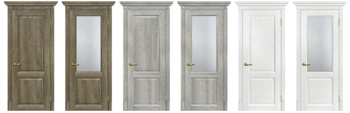
Тоскана 1 Бруно, Тоскана 1 Бруно, Тоскана 1 Чиаро гриджио, Тоскана 1 Чиаро гриджио, Тоскана 1 Пломбир, Тоскана 1 Пломбир