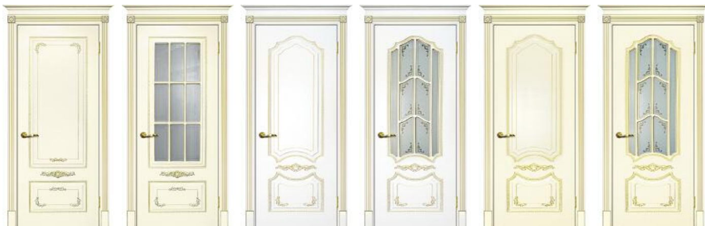
Смальта 09 Слоновая кость патина золото Смальта 09 Слоновая кость патина золото Смальта 10 Белый патина золото Смальта 10 Белый патина золото Смальта 10 Слоновая кость патина золото Смальта 10 Слоновая кость патина золото