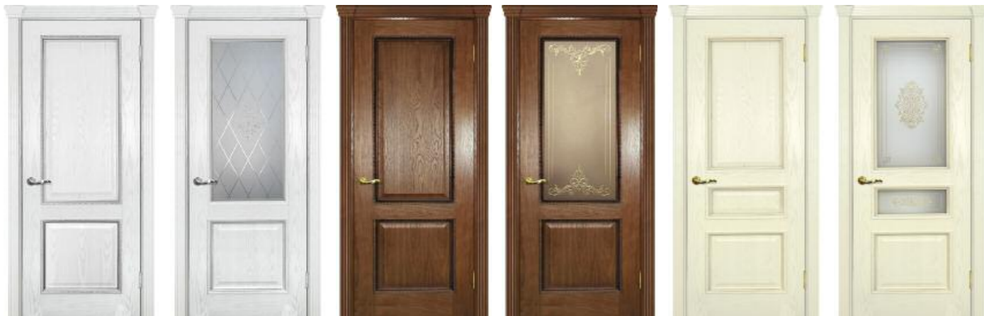
Фрейм 02 Ясень айсберг, Фрейм 02 Дуб, Фрейм 03 Ясень бисквит