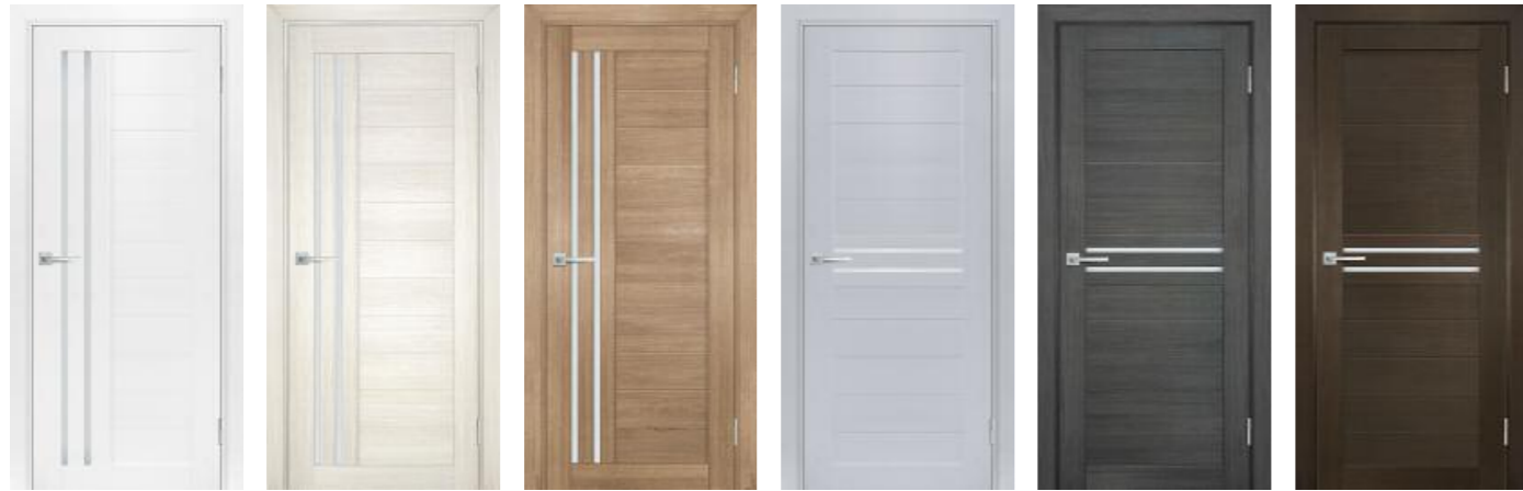
Техно 738 Белоснежный Техно 738 Сандал бежевый Техно 738 Миндаль Техно 739 Муссон Техно 739 Грей Техно 739 Венге