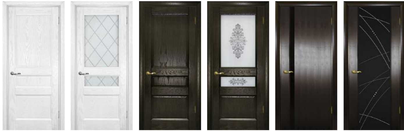
Вайт 02 Ясень айсберг, Вайт 02 Ясень айсберг, Вайт 02 Дуб патинированный, Вайт 02 Дуб патинированный, Страто 01 Черный дуб, Страто 02 Черный дуб