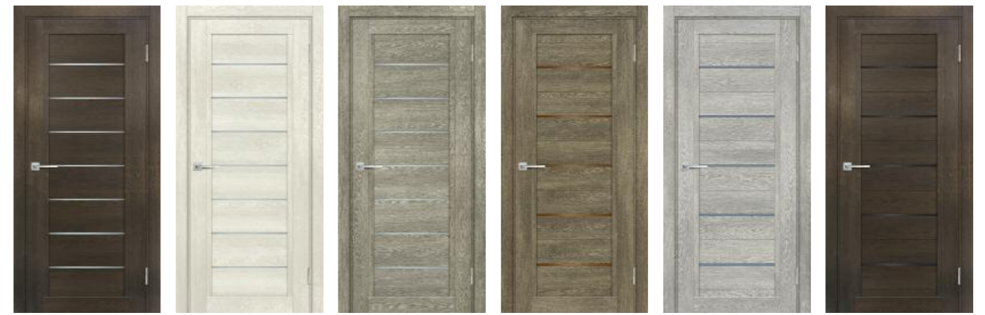
Техно 808 Фреско, Техно 808 Бьянко, Техно 808 Гриджио, Техно 809 Бруно, Техно 809 Чиаро гриджио, Техно 809 Фреско