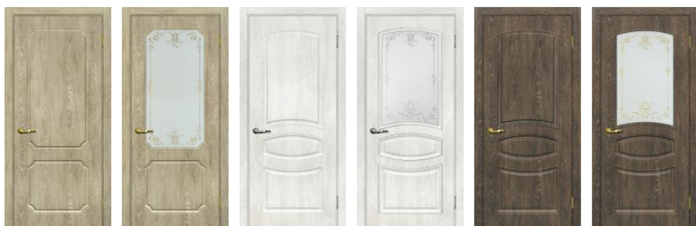
Сиена 4 Дуб песочный Сиена 4 Дуб песочный Сиена 5 Дуб жемчужный Сиена 5 Дуб жемчужный Сиена 5 Дуб корица Сиена 5 Дуб корица