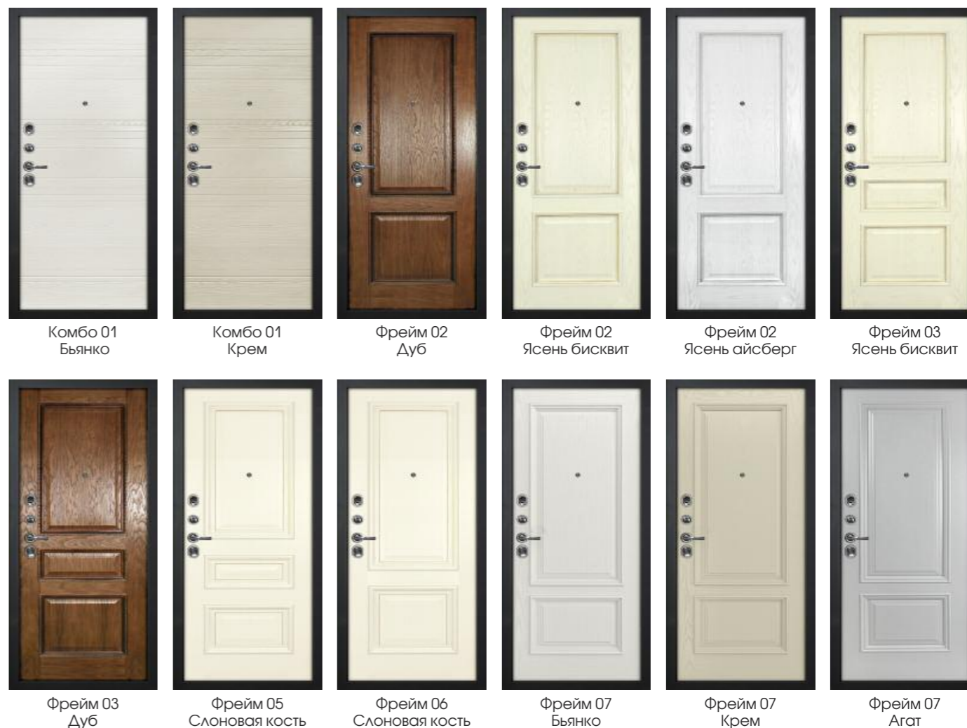
Комбо 01 Бьянко Комбо 01 Крем Фрейм 02 Дуб Фрейм 02 Ясень бисквит Фрейм 02 Ясень айсберг Фрейм 03 Ясень бисквит