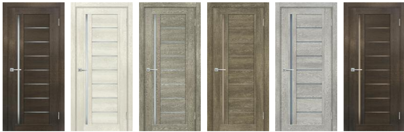
Техно 801 Фреско, Техно 801 Бьянко, Техно 801 Гриджио, Техно 801 Бруно, Техно 801 Чиаро гриджио, Техно 801 Фреско