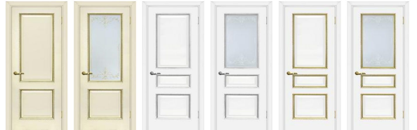
Мурано 1 Магнолия патина золото Мурано 1 Магнолия патина золото Мурано 2 Белый патина серебро Мурано 2 Белый патина серебро Мурано 2 Белый патина золото Мурано 2 Белый патина золото