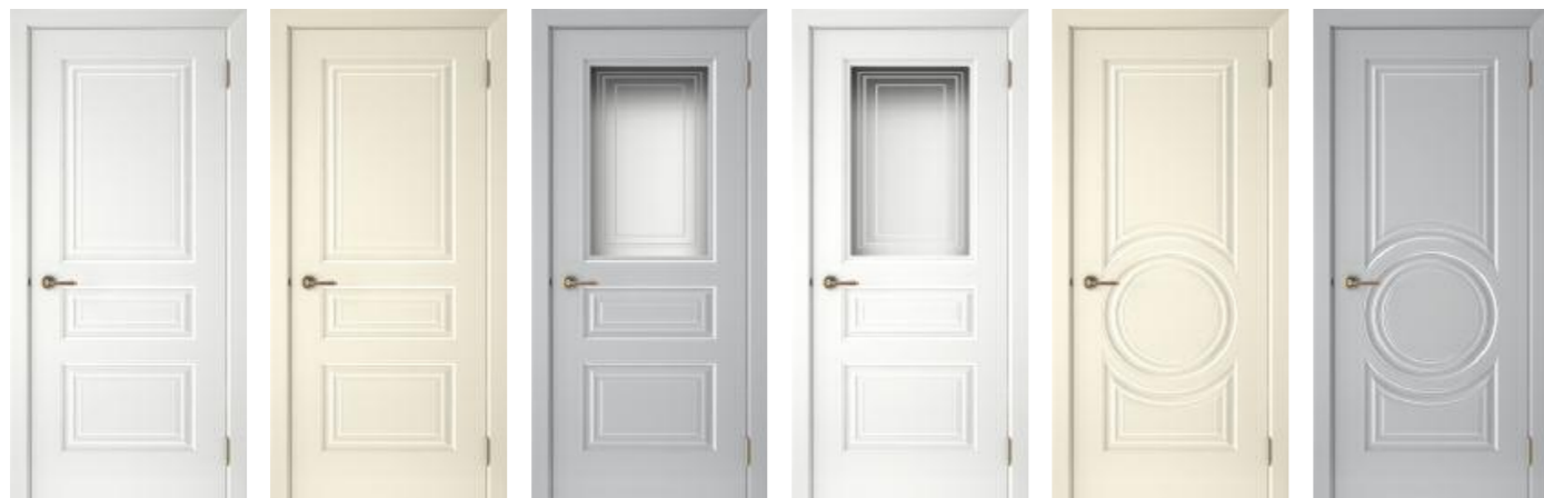
Смальта 44 Белый Смальта 44 Ваниль Смальта 44 Серый Смальта 44 Белый Смальта 45 Ваниль Смальта 45 Серый