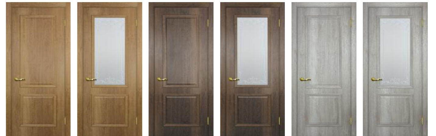
Верона 1 Дуб арагон Верона 1 Дуб арагон Верона 1 Дуб сан-томе Верона 1 Дуб сан-томе Верона 1 Дуб эссо Верона 1 Дуб эссо