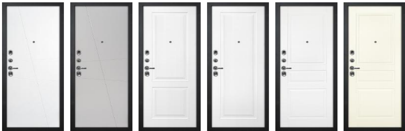
Смальта-Лайн 02 Белый RAL 9003 Смальта-Лайн 02 Агат RAL 7044 Смальта-Лайн 04 Белый RAL 9003 Смальта-Лайн 06 Белый RAL 9003 Смальта 01 Белый RAL 9003 Смальта 01 Слоновая кость RAL 1013