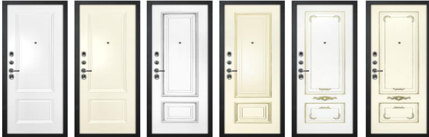
Смальта 07 Белый RAL 9003 Смальта 07 Слоновая кость RAL 1013 Смальта 08 Белый RAL 9003 патина серебро Смальта 08 Слоновая кость RAL 1013 патина золото Смальта 09 Белый RAL 9003 патина золото Смальта 09 Слоновая кость RAL 1013 патина шампань