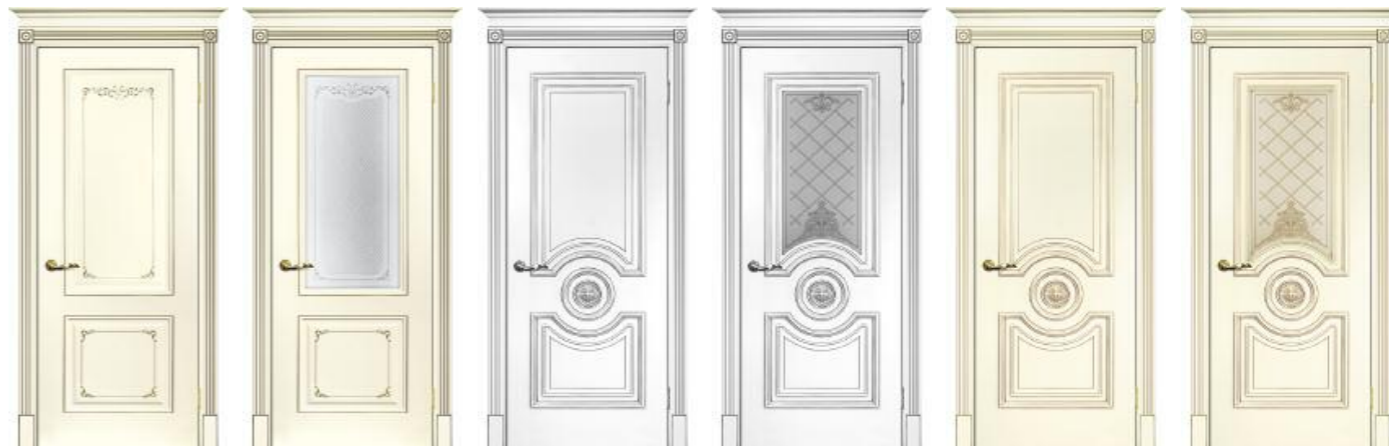
Смальта 14 Слоновая кость патина шампань Смальта 14 Слоновая кость патина шампань Смальта 18 Белый патина серебро Смальта 18 Белый патина серебро Смальта 18 Слоновая кость патина золото Смальта 18 Слоновая кость патина золото