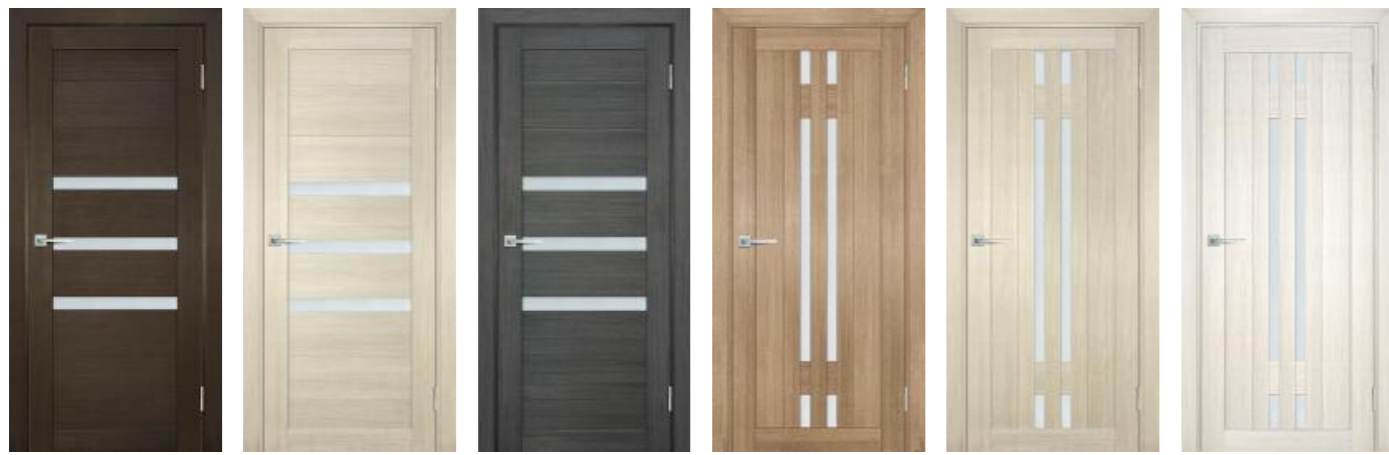
Техно 709 Венге Техно 709 Капучино Техно 709 Грей Техно 733 Миндаль Техно 733 Капучино Техно 733 Сандал бежевый