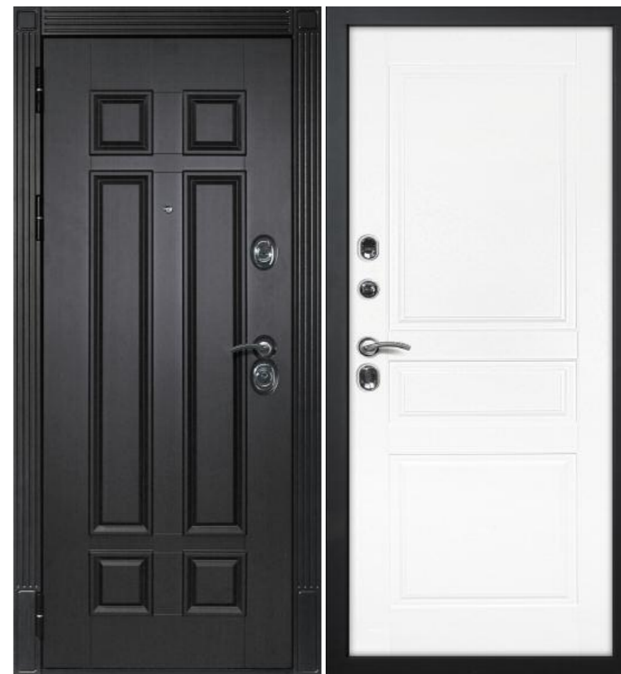
Входная дверь ГЕРА - 2 Венге (без внутренней панели)