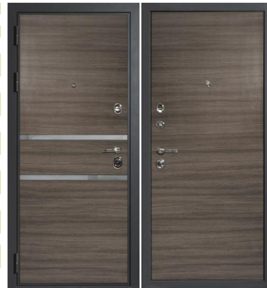
Входная дверь П-2/2