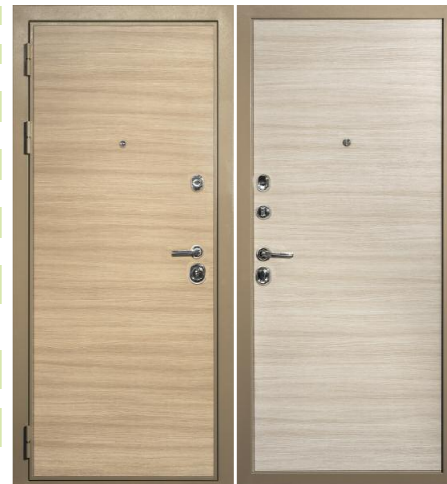
Входная дверь П-2/3