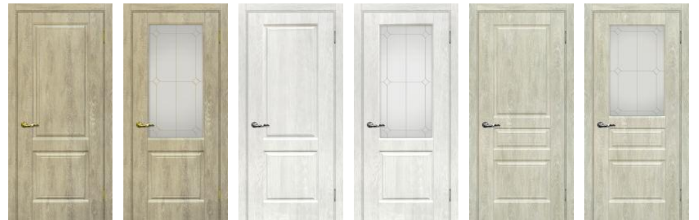
Версаль 1 Дуб песочный Версаль 1 Дуб песочный Версаль 1 Дуб жемчужный Версаль 1 Дуб жемчужный Версаль 2 Дуб седой Версаль 2 Дуб седой