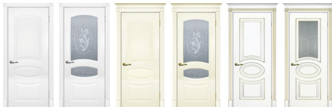
Смальта 02 Белый Смальта 02 Белый Смальта 02 Слоновая кость Смальта 02 Слоновая кость Смальта 03 Белый патина золото Смальта 03 Белый патина золото