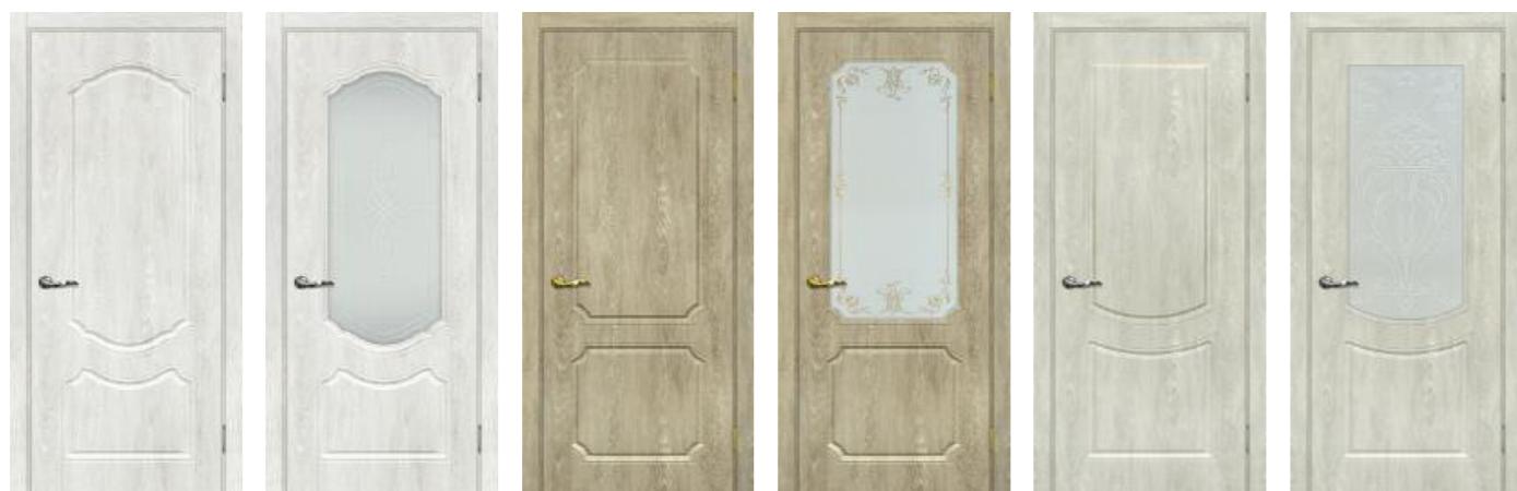
Сиена 2 Дуб жемчужный Сиена 2 Дуб жемчужный Сиена 3 Дуб песочный Сиена 3 Дуб песочный Сиена 3 Дуб седой Сиена 3 Дуб седой