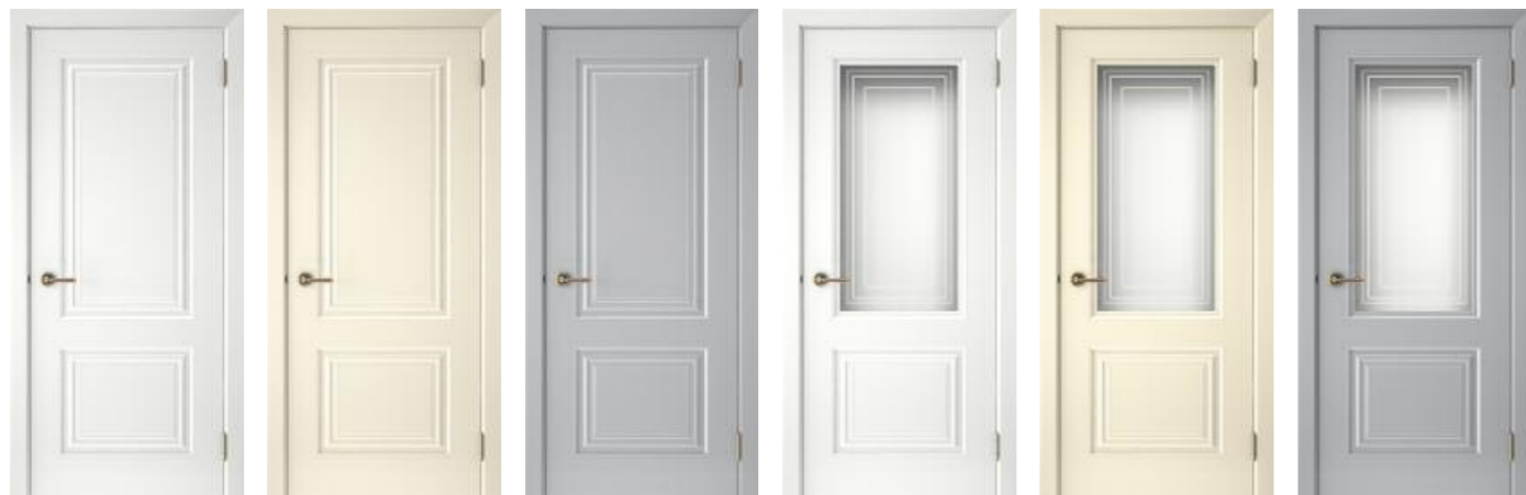
Смальта 42 Белый Смальта 42 Ваниль Смальта 42 Серый Смальта 42 Белый Смальта 42 Ваниль Смальта 42 Серый