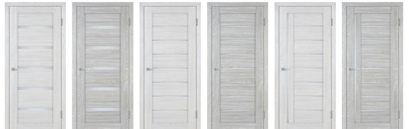
Лайт 07 Арктик Лайт 07 Нордик Лайт 08 Арктик Лайт 08 Нордик Лайт 41 Арктик Лайт 41 Нордик