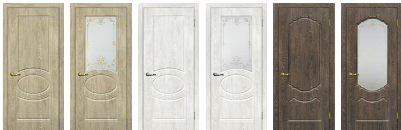
Сиена 1 Дуб песочный Сиена 1 Дуб песочный Сиена 1 Дуб жемчужный Сиена 1 Дуб жемчужный Сиена 2 Дуб корица Сиена 2 Дуб корица