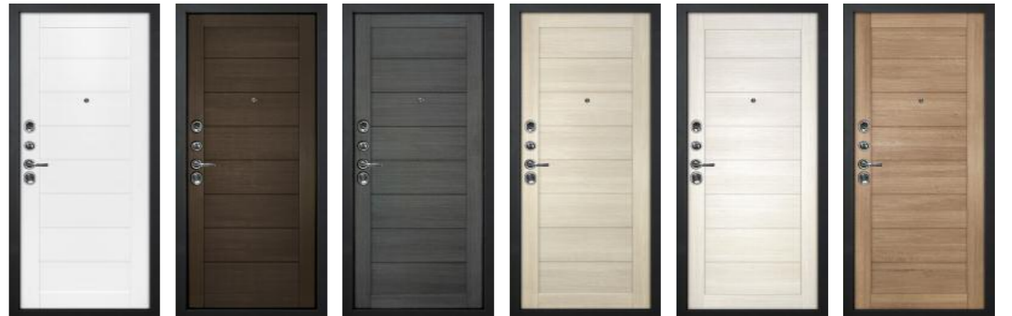
Техно - 708 Белый Техно - 708 Венге Техно - 708 Грей Техно - 708 Капучино Техно - 708 Сандал бежевый Техно - 708 Миндаль