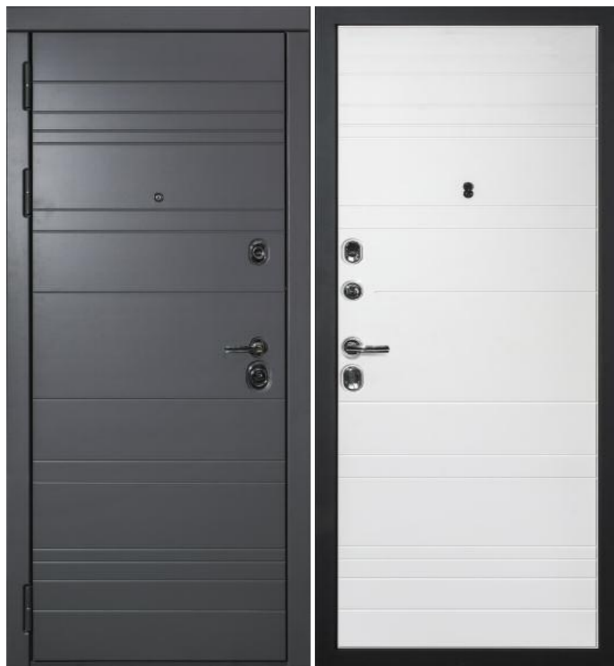
Входная дверь П-1