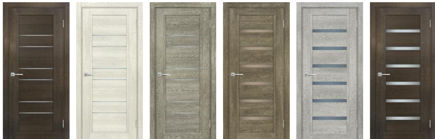
Техно 806 Фреско, Техно 806 Бьянко, Техно 806 Гриджио, Техно 807 Бруно, Техно 807 Чиаро гриджио, Техно 807 Фреско