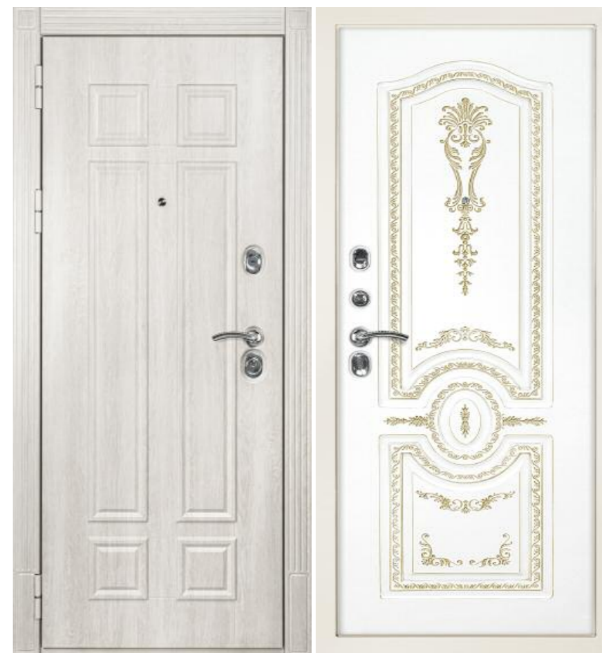
Входная дверь ГЕРА - 2 Крем дуб филадельфия (без внутренней панели)