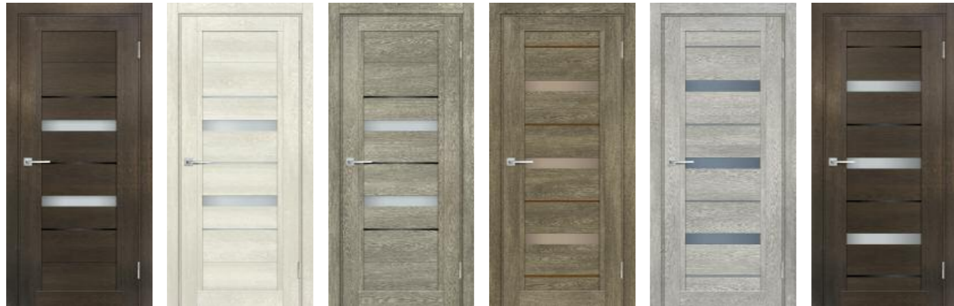
Техно 802 Фреско, Техно 802 Бьянко, Техно 802 Гриджио, Техно 803 Бруно, Техно 803 Чиаро гриджио, Техно 803 Фреско