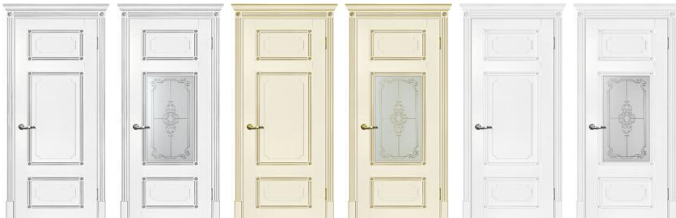
Флоренция 3 Белый патина серебро Флоренция 3 Белый патина серебро Флоренция 3 Магнолия патина золото Флоренция 3 Магнолия патина золото Флоренция 3 Белый Флоренция 3 Белый