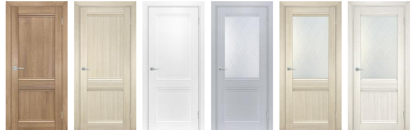
Техно 701 Миндаль, Техно 701 Капучино, Техно 701 Белоснежный, Техно 702 Муссон, Техно 702 Капучино, Техно 702 Сандал бежевый