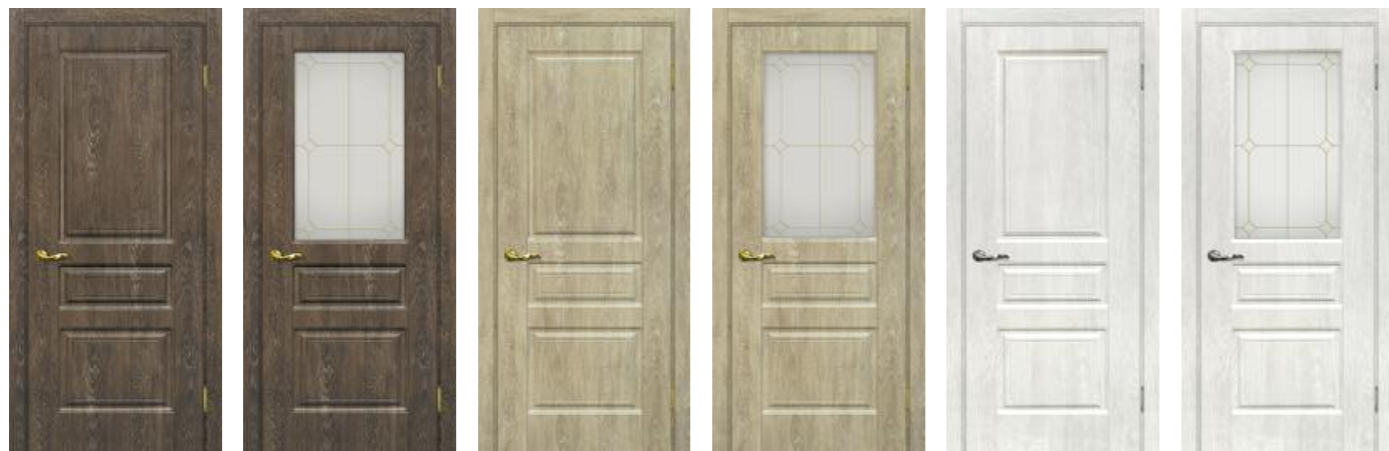
Версаль 2 Дуб корица Версаль 2 Дуб корица Версаль 2 Дуб песочный Версаль 2 Дуб песочный Версаль 2 Дуб жемчужный Версаль 2 Дуб жемчужный