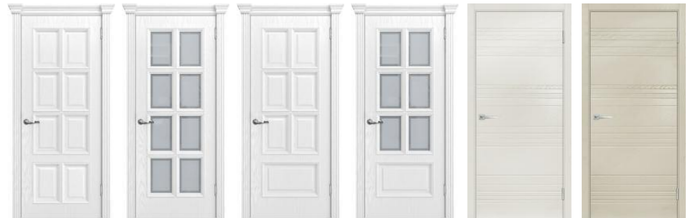
Фрейм 09 Ясень белоснежный, Фрейм 10 Ясень белоснежный, Комбо 01 Бьянко