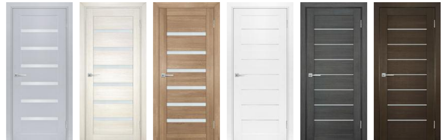
Техно 707 Муссон, Техно 707 Сандал бежевый, Техно 707 Миндаль, Техно 708 Белоснежный, Техно 708 Грей, Техно 708 Венге