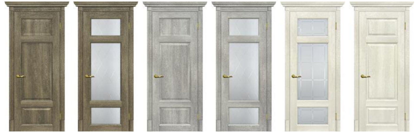
Тоскана 3 Бруно, Тоскана 3 Бруно, Тоскана 3 Чиаро гриджио, Тоскана 3 Чиаро гриджио, Тоскана 3 Бьянко, Тоскана 3 Бьянко