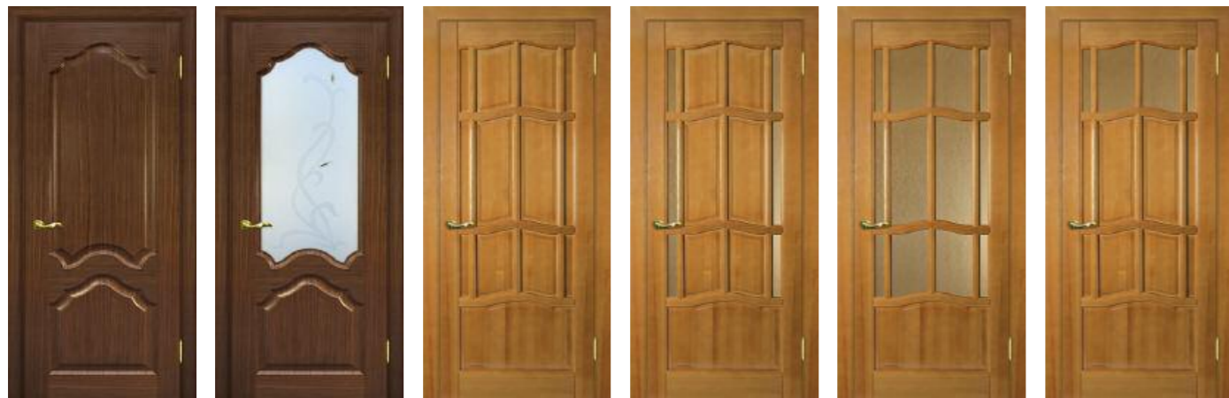
Кардинал Темный орех, Кардинал Темный орех, Амбир, Амбир ДБО, Амбир ДО, Амбир ДВО