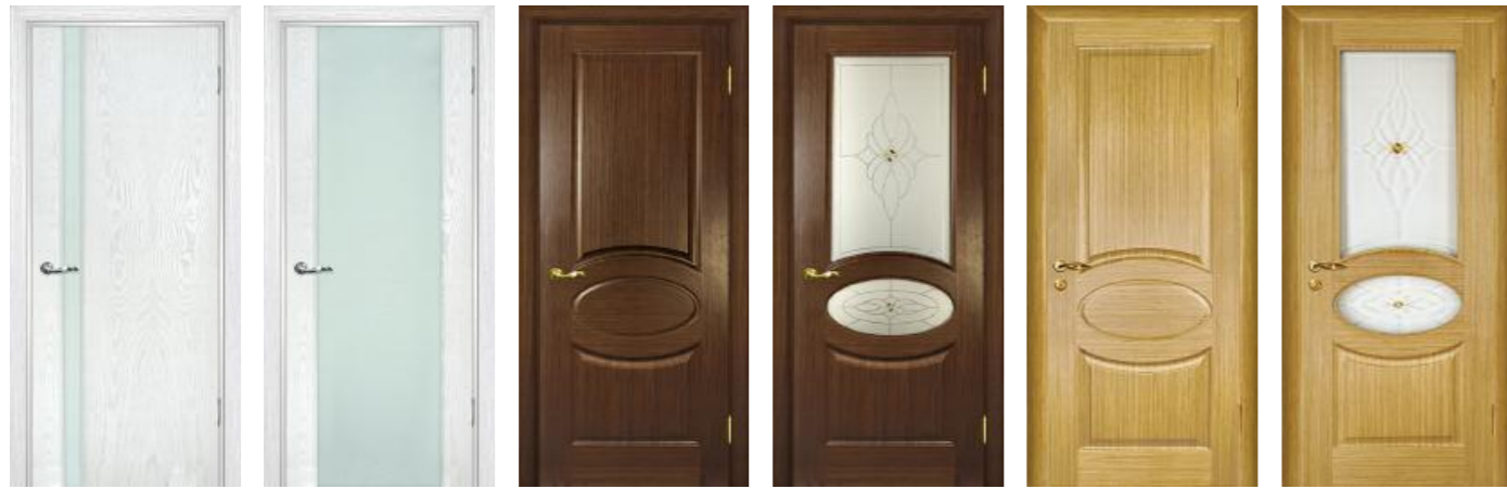
Страто 01 Ясень айсберг, Страто 02 Ясень айсберг, Алекс Темный орех, Алекс Темный орех, Алекс Светлый дуб, Алекс Светлый дуб